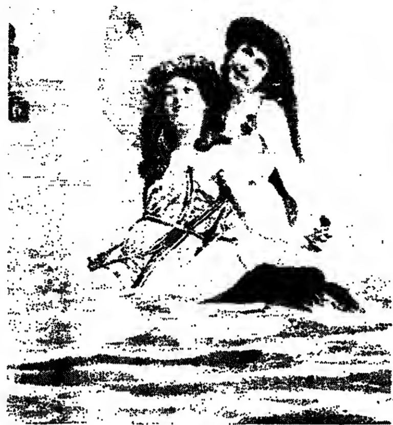
Badenixen um 1900.

Noch vor wenigen Jahrzehnten kostete der Sprung vom Strand ins Wasser einen hohen Preis. Das dokumentieren zwei Ausstellungen, die einen Rückblick auf 200 Jahre Badeleben an Nord- und Ostsee geben.